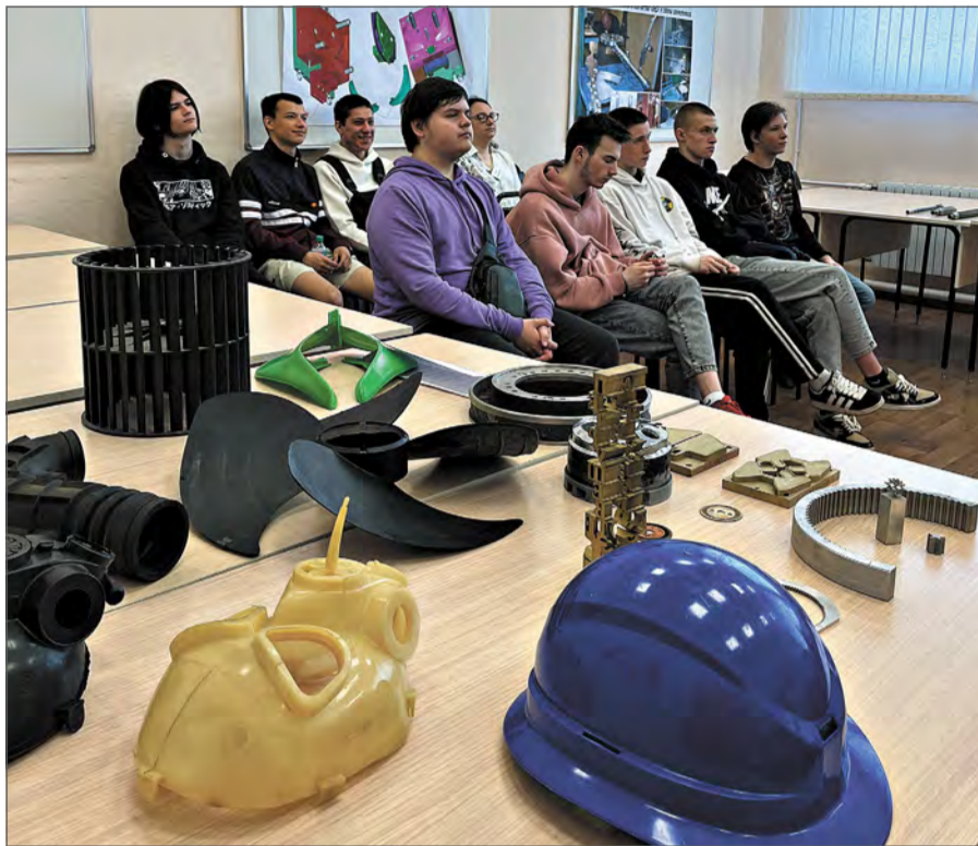
Площадка производства №50.

Приятным бонусом стала возможность не только увидеть продукцию ЗиДа, но и взять её в руки.