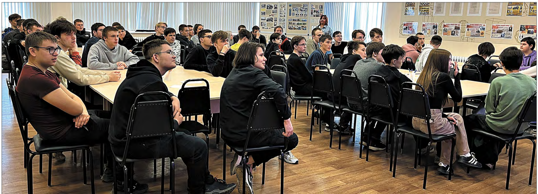
Участники «Своей игры».

Основные производства и цехи завода разместили образцы своей продукции, информационные стенды и другие наглядные материалы в аудиториях Учебного центра. В каждом таком образовательном кластере студентам было предложено послушать небольшую интерактивную лекцию, а в конце – ответить на вопросы и заработать специальные жетоны – «зидики». Жетоны пригодились для финала мероприятия – на них можно было «покупать» вопросы в «Своей игре» на заводскую тематику.