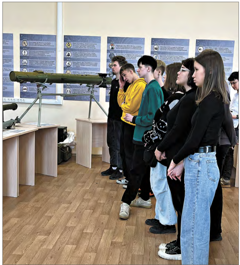
Площадка производства №9.

22 апреля на заводе стартовала Всероссийская акция «Неделя без турникетов». В этом году она проходит в новом формате.