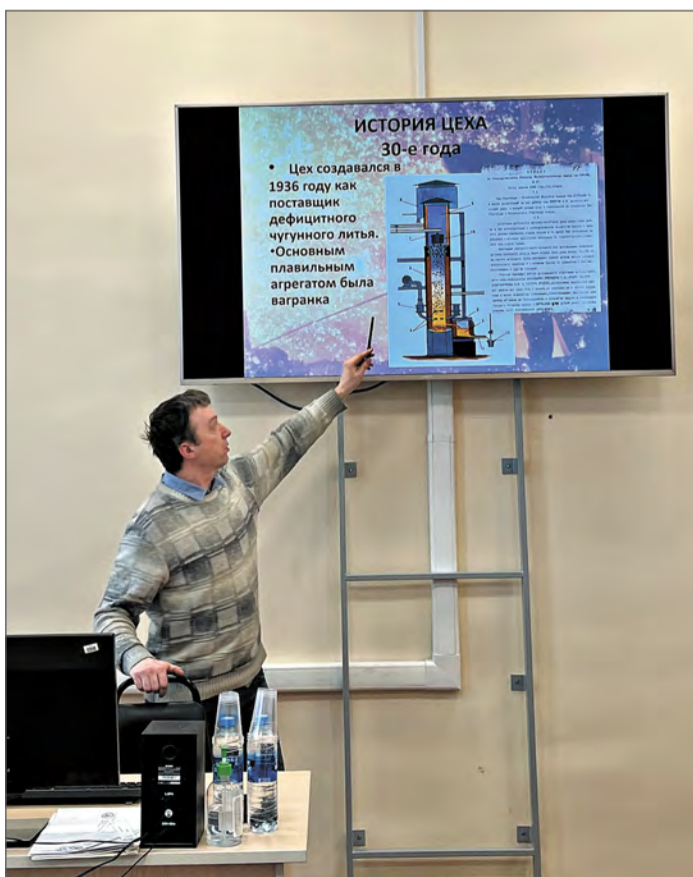
Площадка цеха №42.