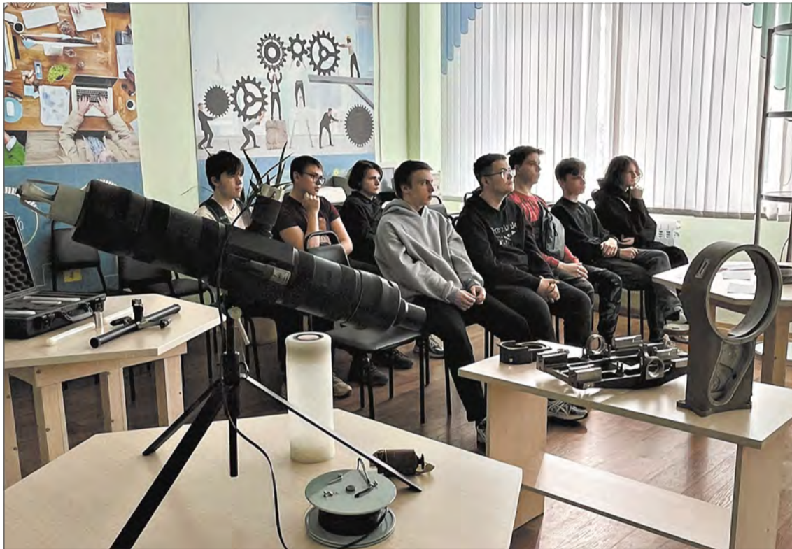
Площадка производства №81.