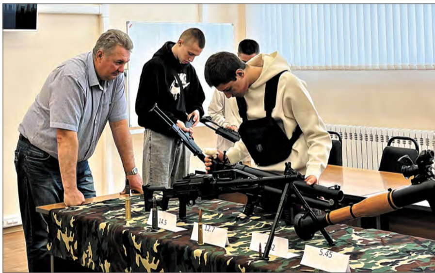
Площадка производства №1.

В аудитории производства №1 студенты смогли поддержать автоматы и гранатометы. Сотрудники цеха №42 предложили участникам «Недели» потрогать готовые отливки и штамповку из алюминиевого сплава, цеха №43 – образцы сплавов до и после термической обработки. Кластер производства №9 представил вниманию учащихся образцы ракет и других своих изделий. Производство №2, помимо основной продукции, студентам продемонстрировало новинку – эвакуационную тележку для раненых. В аудитории производства №81 участники мероприятия смогли увидеть разрушитель взрывоопасных предметов, производства №50 – мерительный и режущий инструмент, а также разнообразные пластмассовые изделия.