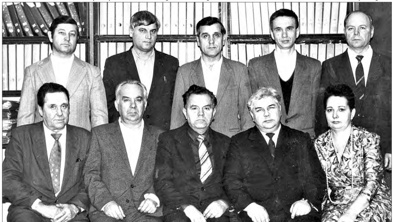
1992 год. Цеху №14 – 20 лет.

И настоящим центром притяжения стал ДК им. Ногина, который распахнул свои двери в 1943 году. Во время войны в ДК им. Ногина были эвакуированы Минский оперный театр и Ростовский театр оперетты. В послевоенные годы на сцене блистали Леонид Утёсов, Клавдия Шульженко, Изабелла Юрьева, Марина Ладынина, Борис Штоколов,