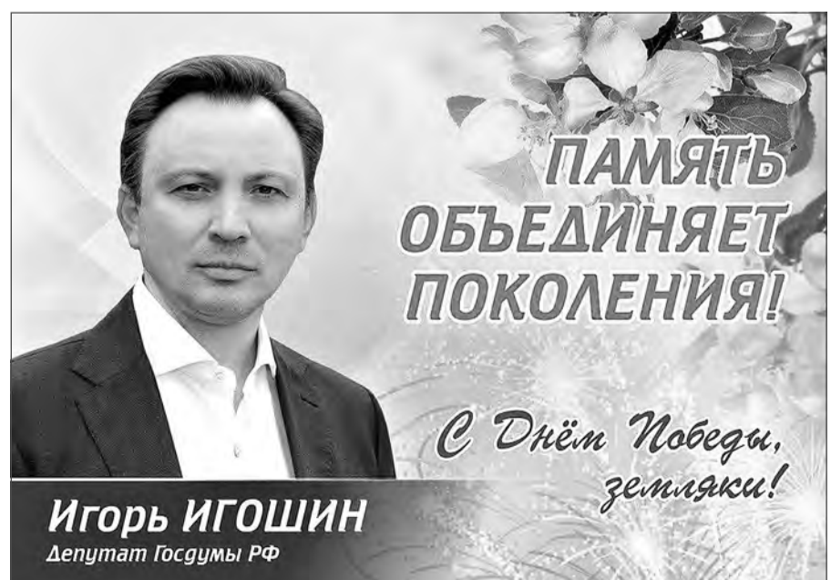
Игорь ИГОШИН Депутат Госдумы РФ

С уважением, ваш депутат Госдумы Игорь Игошин.