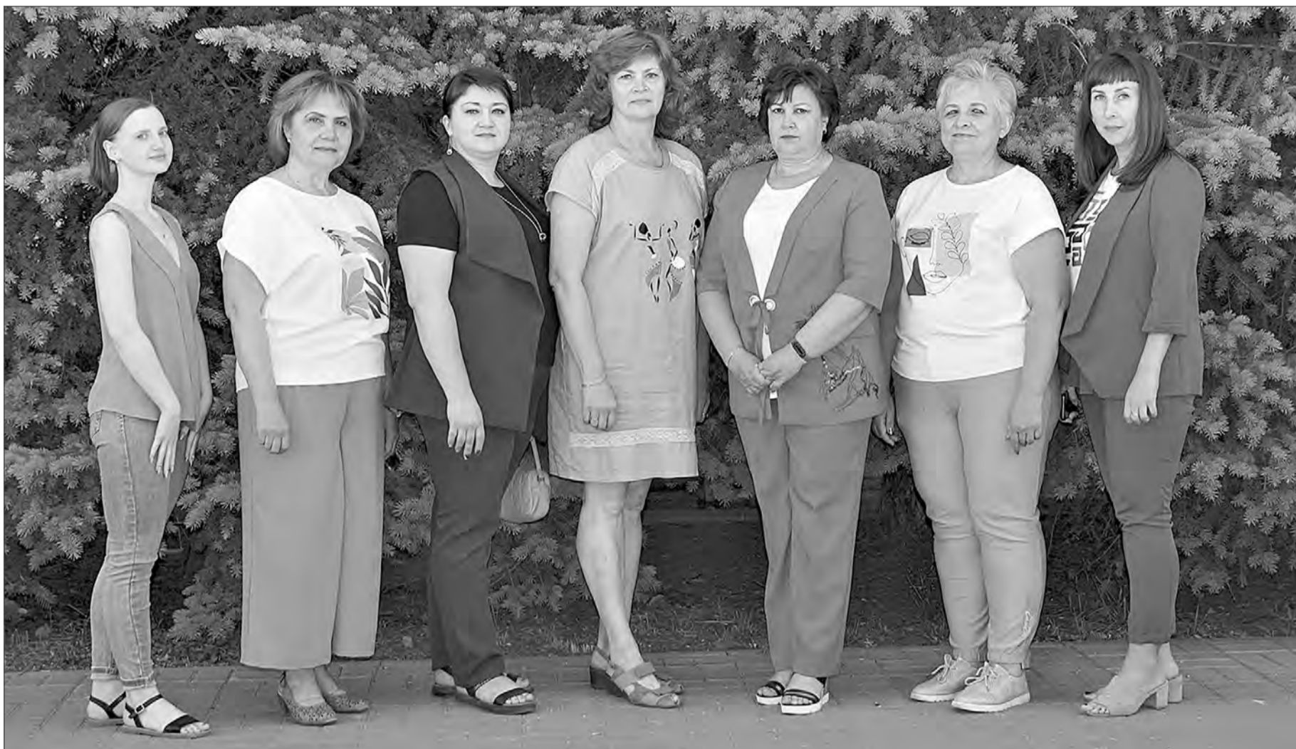
Коллектив конструкторско-технологического бюро стандартизации и нормоконтроля.

Сегодня последователи В.Г. Фёдорова на заводе им. В.А. Дегтярева не занимаются проблемами стандартизации в том виде, в котором видел их Владимир Григорьевич 95 лет назад. Идеи Фёдорова выразились в единую систему конструкторской документации, состоящую из целого ряда нормативных документов, регламентирующих разработку конструкторских чертежей на любые создаваемые изделия.