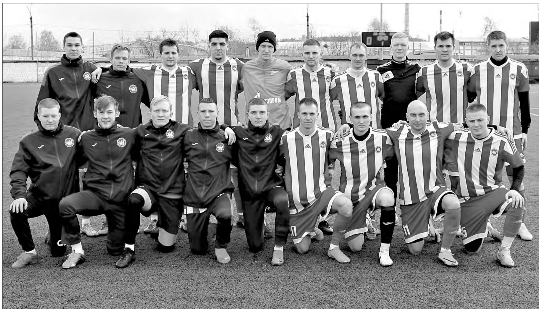
ФК «Зид» – 2024.

– К сожалению, несколько лет назад в Коврове была полностью уничтожена система подготовки начинающих футболистов, и тем тренерам, которые у нас в городе занимаются юными футболистами, пришлось буквально всё начинать с начала, а это очень долгий и болезненный процесс. Сегодня у нас