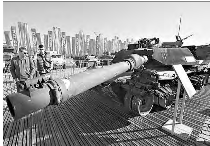
Трофейный танк Abrams, захваченный российскими военнослужащими в ходе спецоперации.

Как сообщил ранее глава Минобороны, парады, посвященные 79-й годовщине Победы в Великой Отечественной войне, пройдут в семи городах-героях и 18 городах, где размещены штабы военных округов, флотов и общевой-