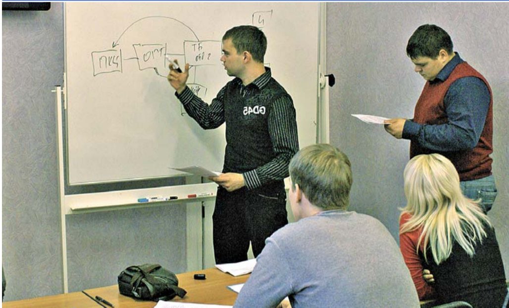
Презентация структурного подразделения от представителей производства №9.