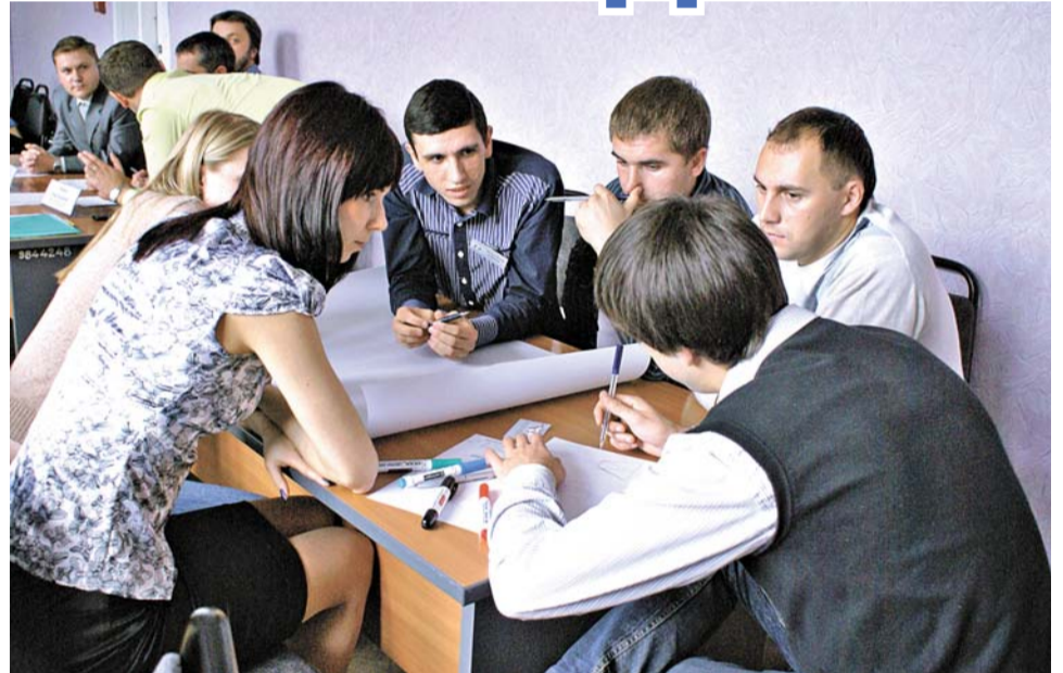
Обсуждение принципа работы сканера для предметов.

На днях закончила работу Школа молодого специалиста. Ее выпускниками стали тридцать человек. Они самые молодые сотрудники предприятия. Их стаж работы на заводе им. В.А. Дегтярева колеблется от нескольких месяцев до нескольких дней. За две недели обучения они узнали, как живет и как работает крупное машиностроительное предприятие, посетили основные производства, изучили основы трудового законодательства, документооборот, ознакомились с системой повышения квалификации кадров, политикой предприятия в области качества и многим другим.