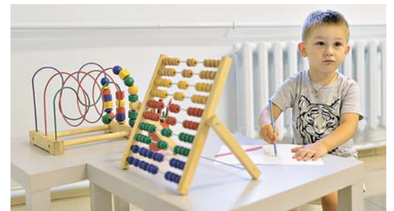
Здесь спокойно можно отправляться с детьми – в вестибюле есть детский уголок.

На первом этаже расположился просторный холл с диванами, ТВ и фито-баром. Крепкому алкоголю здесь говорят решительное «нет», а вот кислородным коктейлям, свежим сокам и прохладительным напиткам – уверенное «да». Захочется попить минеральной водички – не стесняйтесь воспользоваться бесплатными кулерами со «Стародубской», они установлены в саунах и раздевалках общих залов. При необходимости здесь можно приобрести все банные принадлежности, включая веники, одноразовые тапочки и простыни.