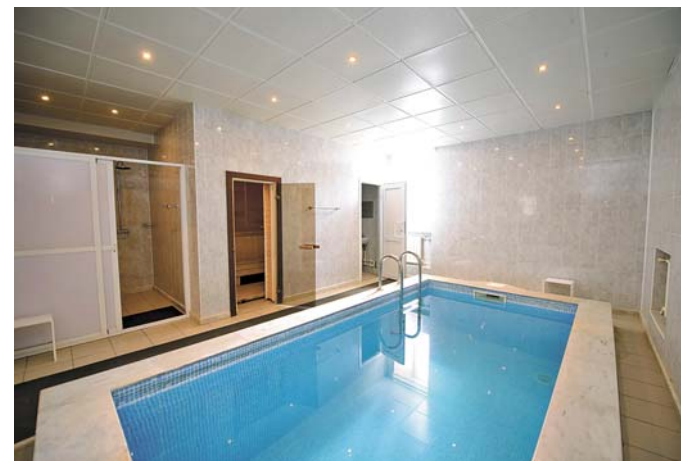
Общие залы бани принимают любителей хорошенько попариться ежедневно с раннего утра и до позднего вечера (кроме санитарного дня – понедельника). Четыре номера повышенной комфортности – 2 сауны с бассейном и 2 сауны с джакузи – работают круглосуточно.