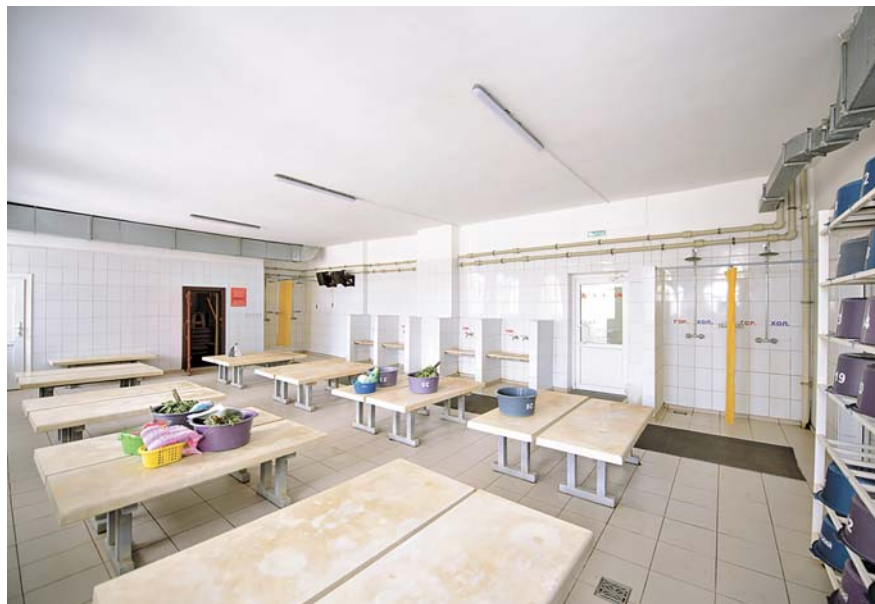
Помывочные залы – светлые и просторные.