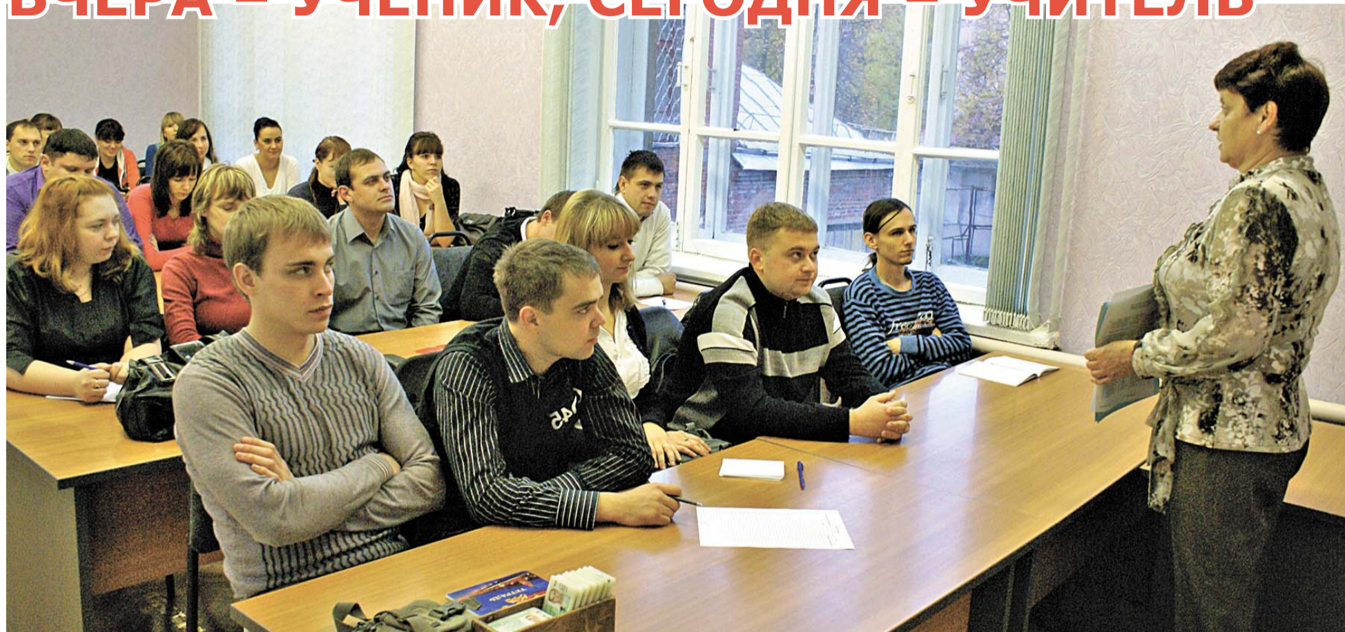
Начала работу школа молодого специалиста.