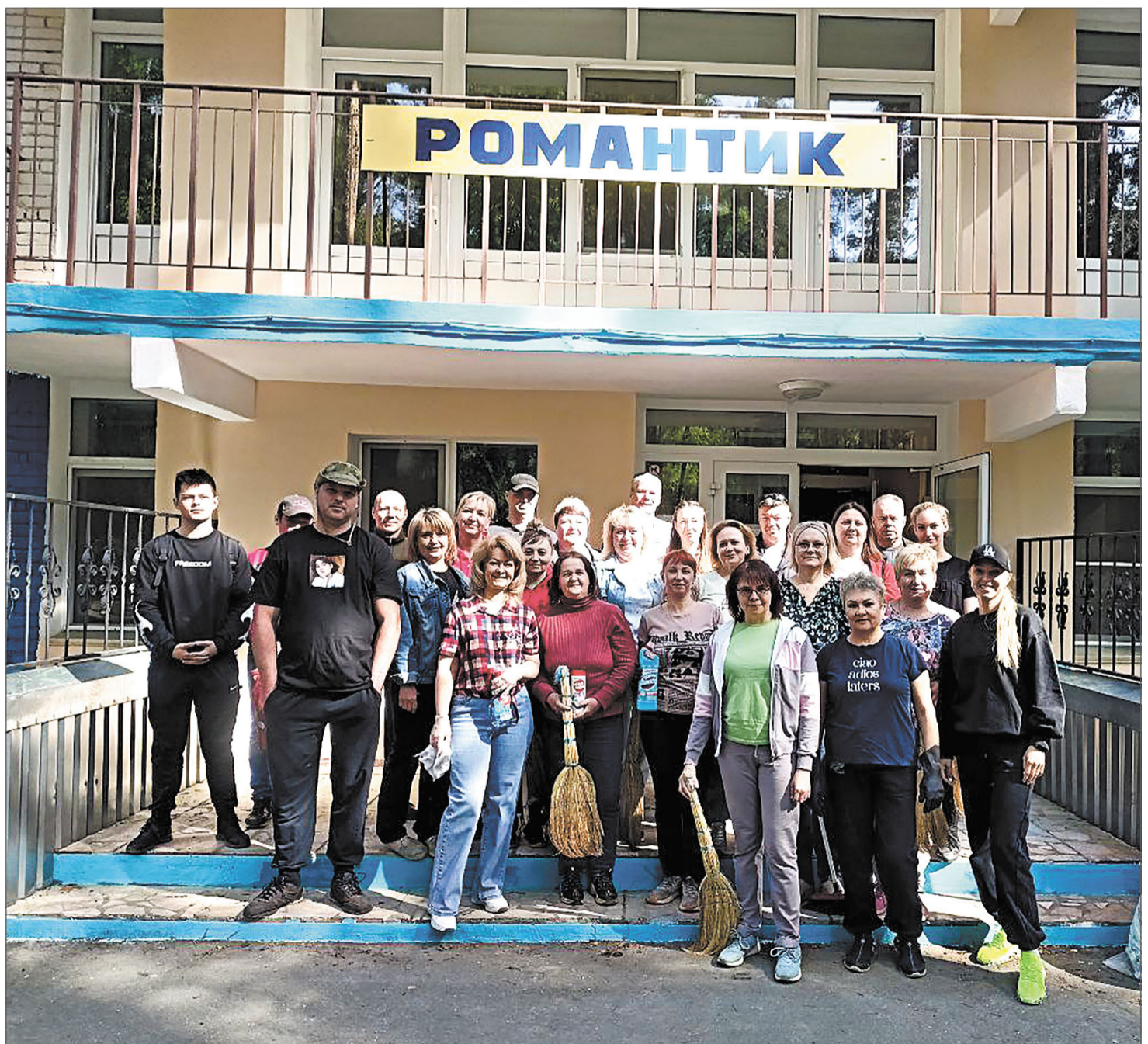
Профсоюзные лидеры подготовили к заселению корпус «Романтик» в лагере «Солнечный».

Подробнее о подготовке лагеря «Солнечный» и турбазы «Суханиха» к летней оздоровительной кампании читайте на стр. 10, 11.