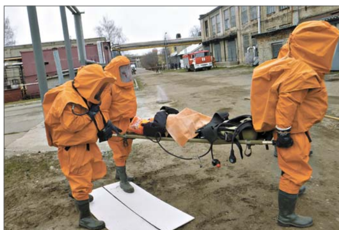
Спасатели в действии.