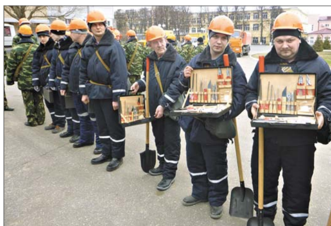
Смотр НО ГО.