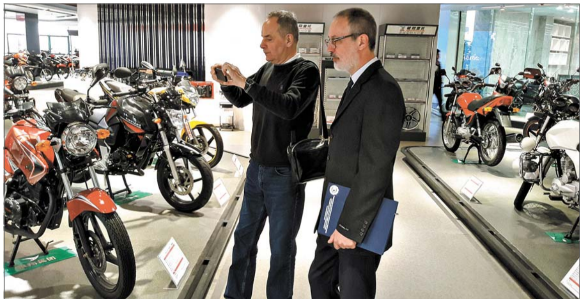
В музее мототехники.