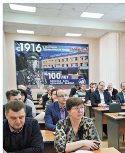
Охрана труда. Не для статистики