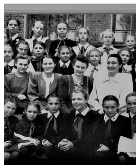
Зид – городу. Детство золотое