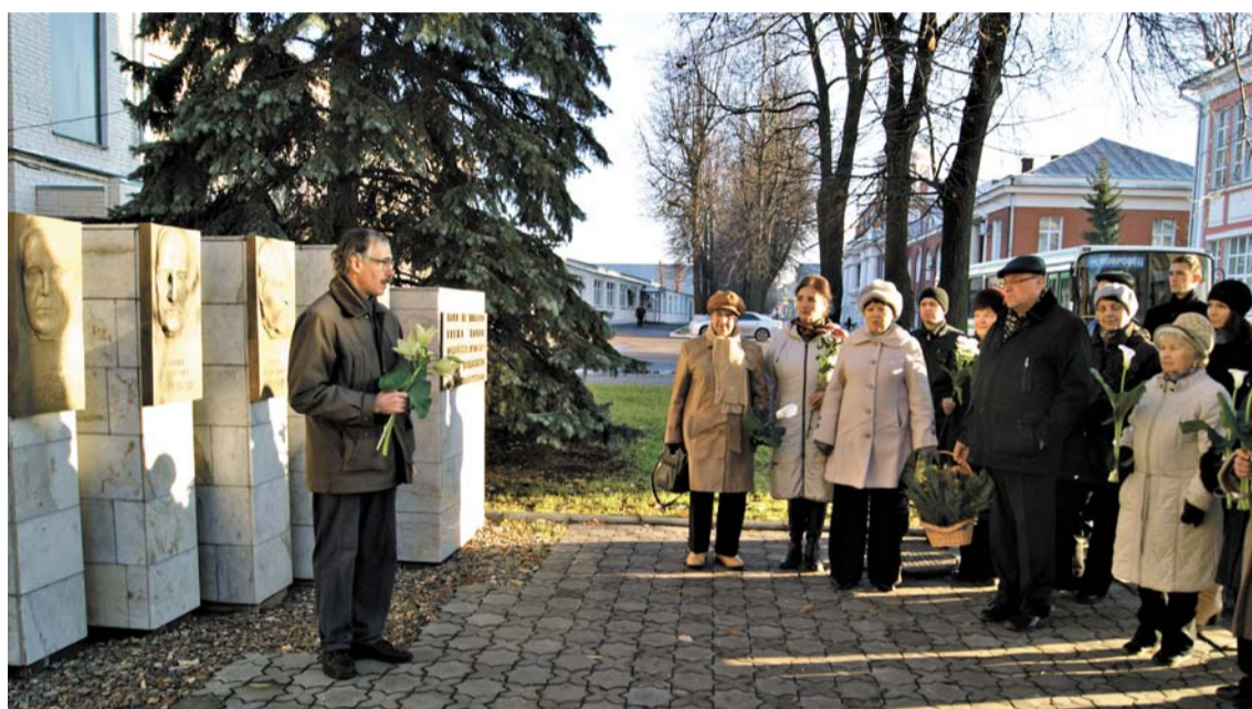
У мемориального комплекса «Конструкторы-оружейники».