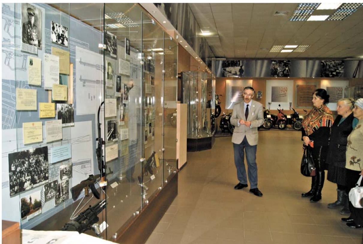
В техноцентре ОАО «Зид».