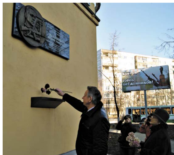
У мемориальной доски (ул. Лепсе, 4).